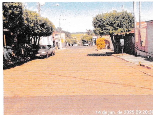
Foto 9 e 10 - RUA ANTONIO FACCO trecho entre a Av. Campos Salles e a Rua Guaianases