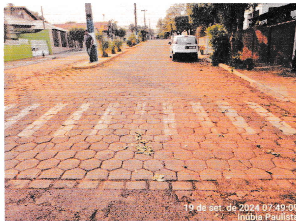
Foto 3 e 4 – Avenida Pedro Antônio Gomes, trecho entre a Rua Iraldo Antônio Martins de Toledo e Av. Campos Salles