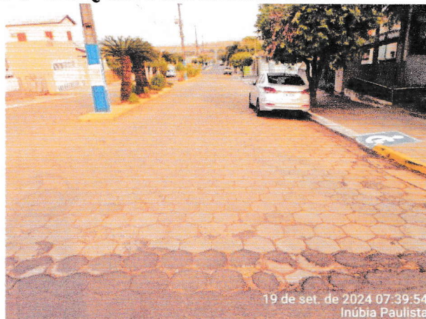
Foto 1 e 2 – Avenida Pedro Antônio Gomes, trecho entre a Av. Campos Salles e a Rua Iraldo Antônio Martins de Toledo