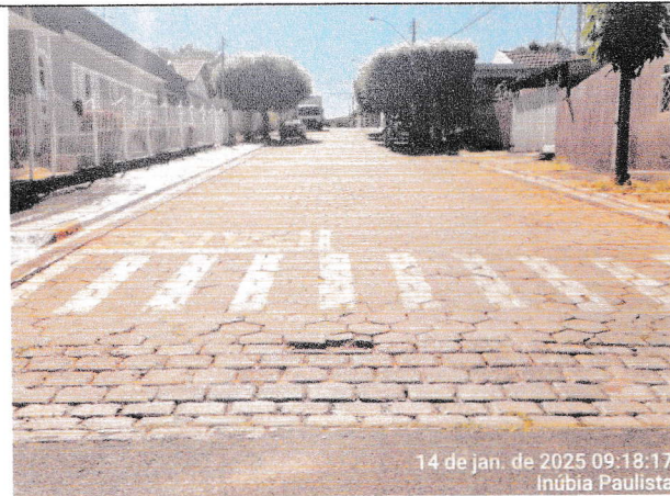
Foto 7 e 8 - RUA ARMANDO DELAI, trecho entre a Av. Campos Salles e a Rua Iraldo Antonio Martins de Toledo