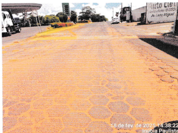
Foto 11 e 12 - AVENIDA LEÃO MIGUEL BANNWART trecho entre a Ferroviária Federal S/A e a Rua Mário Covas