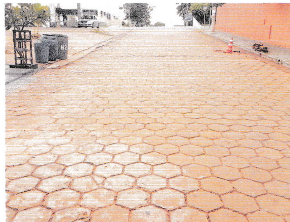
Foto 5 e 6 - Rua Luís Cassandri, trecho entre a Av. Campos Salles e a Rua Iraldo Antonio Martins de Toledo